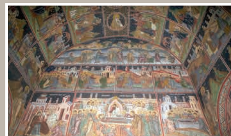
Detalii Pictură Interior