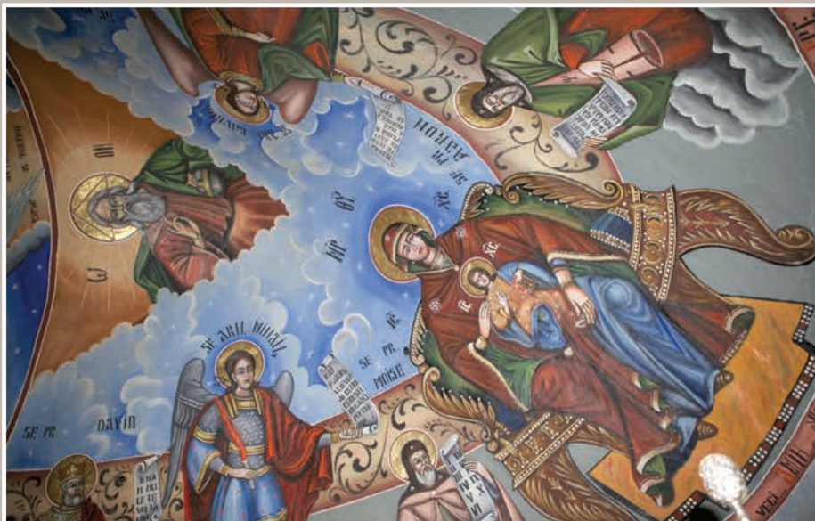
Detalii Pictură Boltă