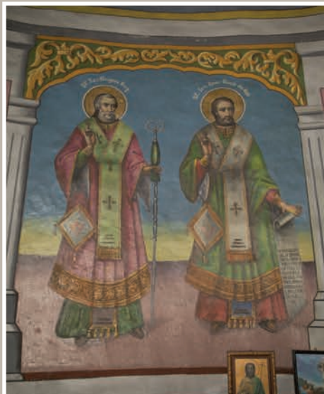
Detalii Pictură Interior