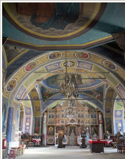
Naos-vedere dinspre Pronaos