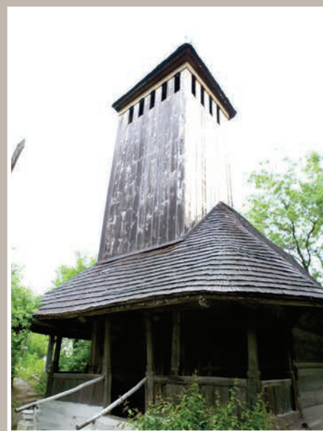
Vedere Sud-Vest, Pridvor

An construcție sau atestare istorică: Datarea, 1793-1796 – conform LMI 2010