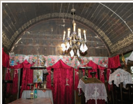
Imagine Naos - Catapeteasmă