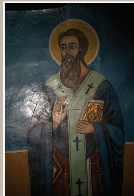
Detaliu Pictură Interioară

An construcție sau atestare istorică: Datare, 1752 – conform LMI 2010