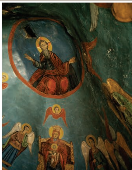
Detaliu Pictură Interioară