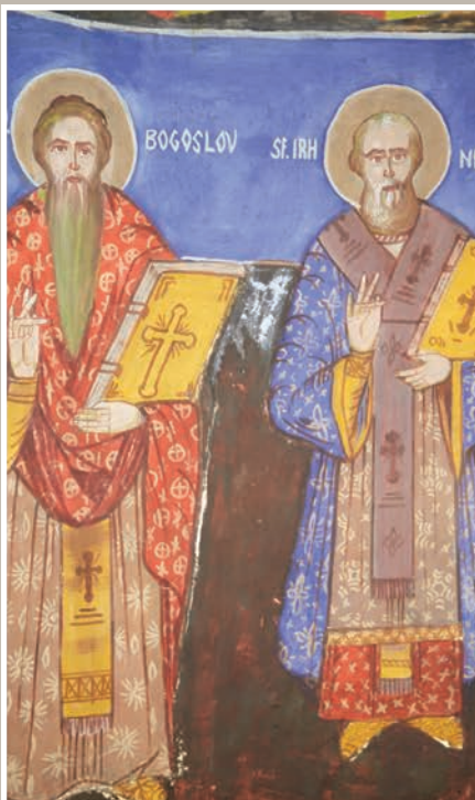
Detaliu Pictură Interioară