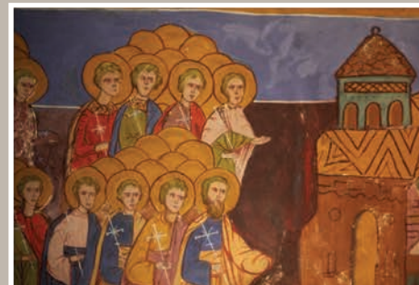
Detaliu Pictură Interioară