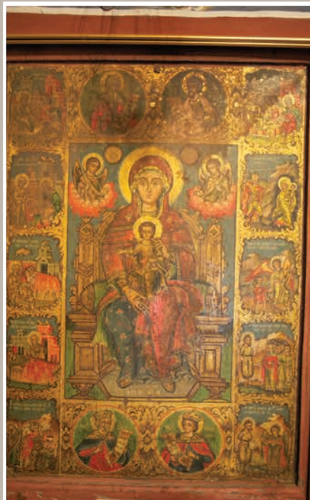
Icoană Maica Domnului cu Pruncul