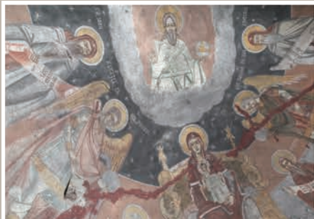
Detaliu Pictură Boltă