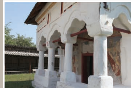
Pridvor Vedere Sud-Vest