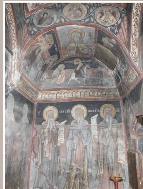
Detaliu Pictură Interioară