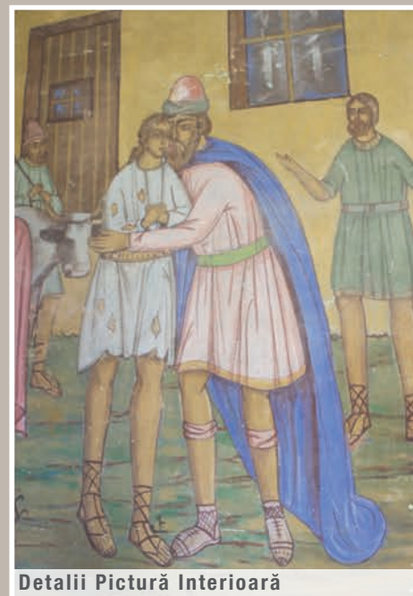
Detalii Pictură Interioară