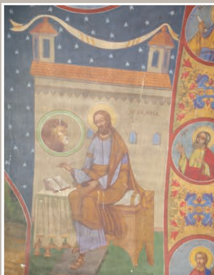
Detalii Pictură Interioară