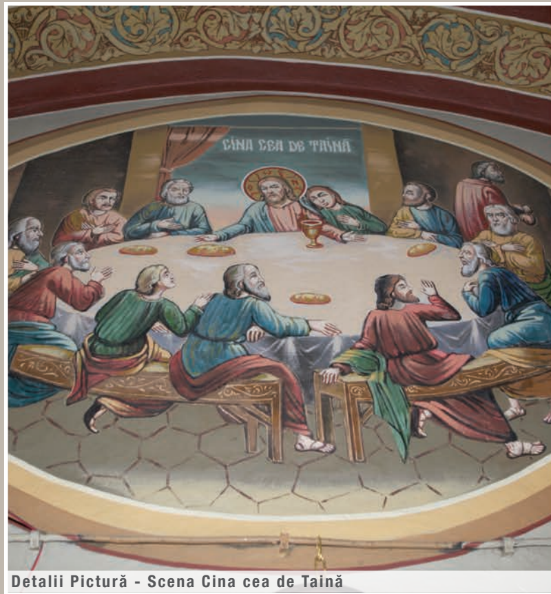
Detalii Pictură - Scena Cina cea de Taină