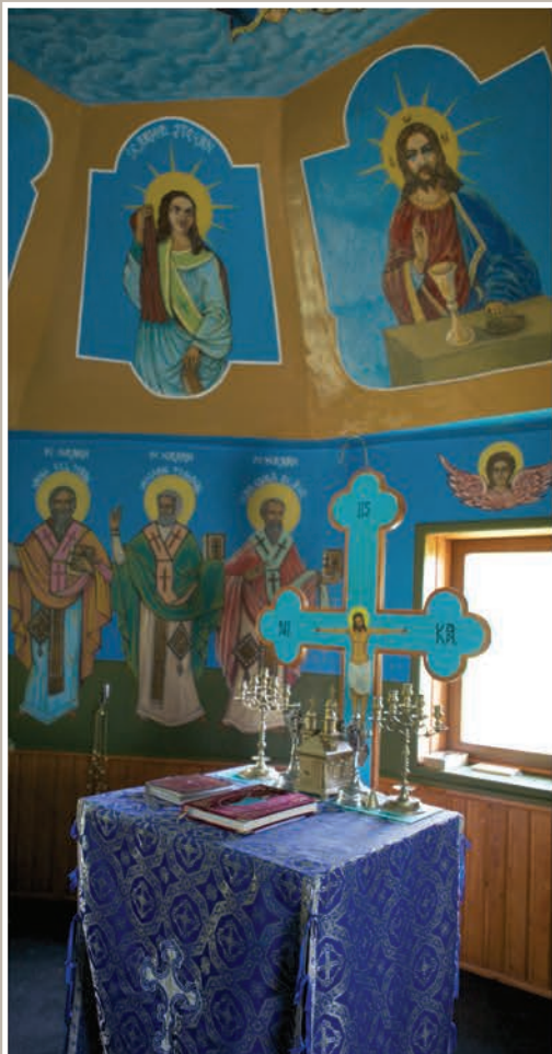
Imagine Interior Altar