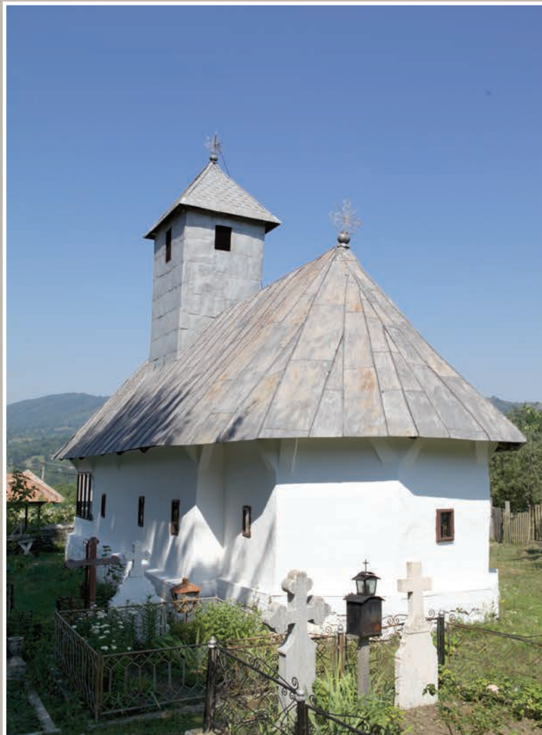
Vedere Sud-Est-Absidă Altar