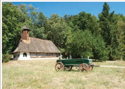
Vedere Amplasament Biserică

Monument istoric. LMI 2010 VL-II-m-A-09959.03 sat VALEA BĂLCEASCĂ; comuna NICOLAE BĂLCESCU