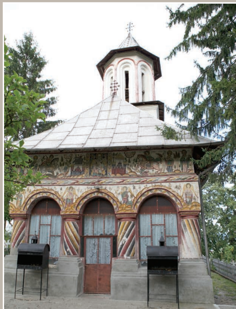
Fațadă Vest-Pridvor închis