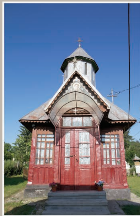
Fațadă Vest-Pridvor închis