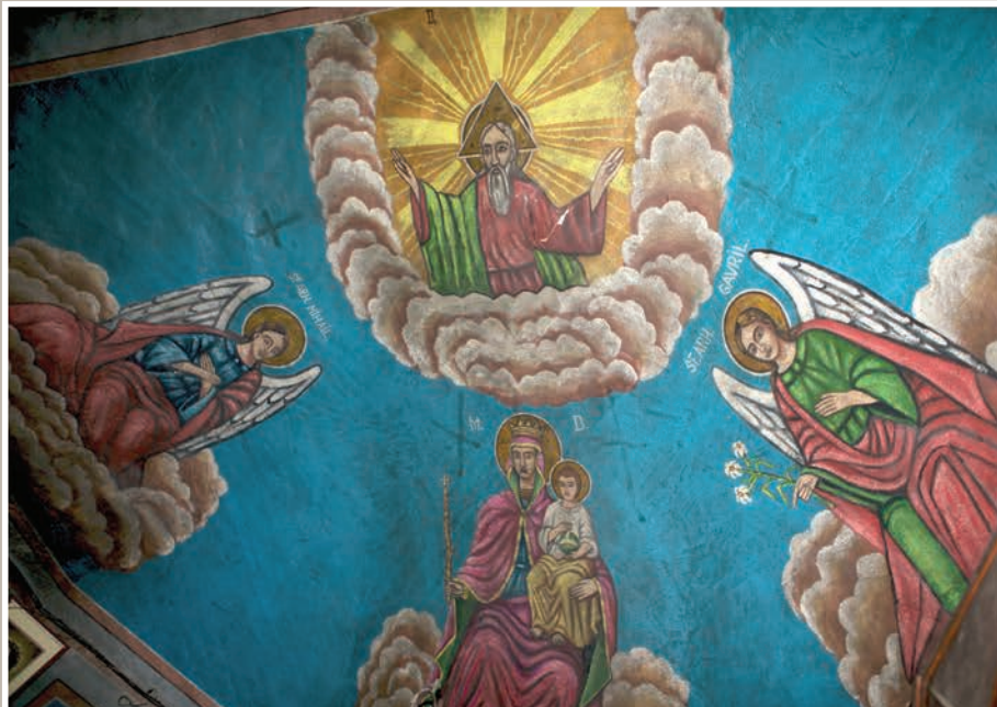
Detalii Pictură Interior