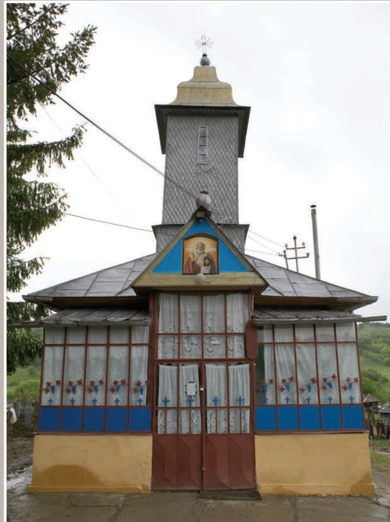
Fațadă Vest-Pridvor închis

An construcție sau atestare istorică: Datare, 1891 – conform LMI 2010