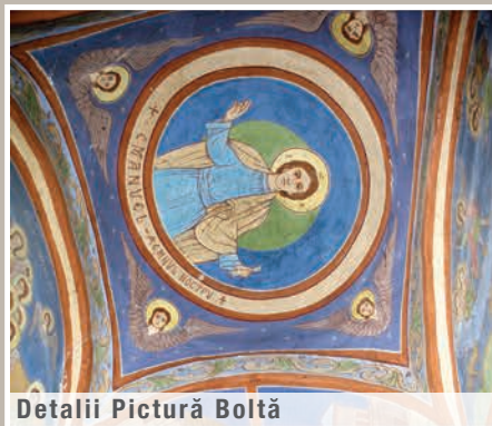
Detalii Pictură Boltă