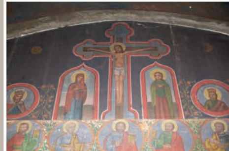
Detalii Catapeteasmă-registru superior