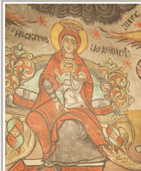
Maica Domnului cu Pruncul