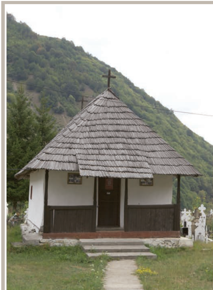
Fațadă Vest-Pridvor deschis