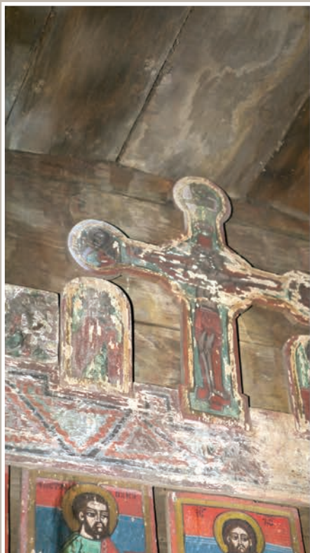
Detalii Catapeteasmă-registru superior