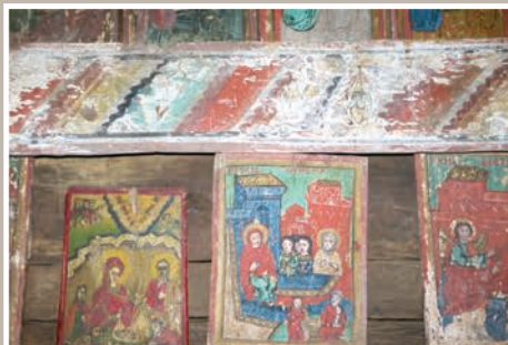
Icoane de lemn