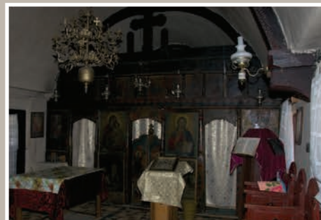
Naos spre Altar