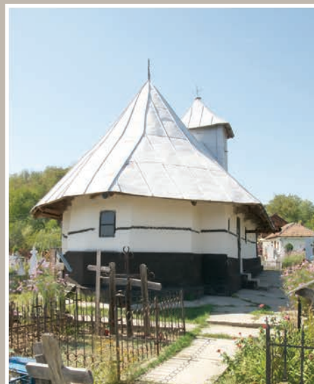
Vedere Nord-Est–Absidă Altar