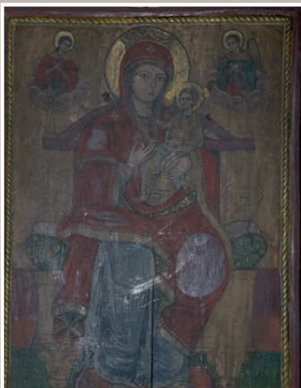
Icoană pictată pe lemn