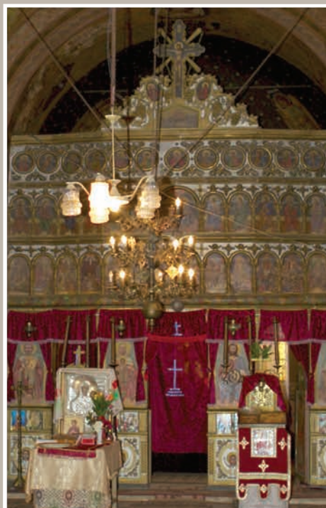
Catapeteasmă – Naos