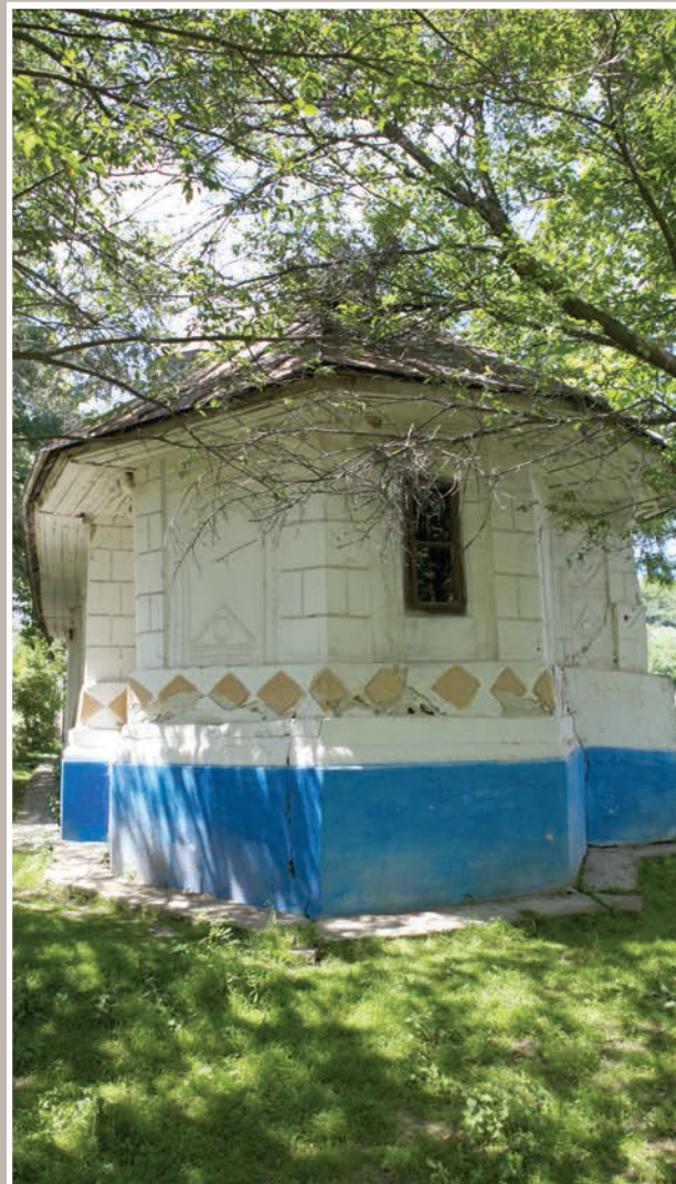
Fațadă Est - Altar

An construcție sau atestare istorică: Datare, 1887-1890 – conform LMI 2010