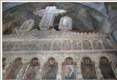
Catapeteasmă – Registru Superior