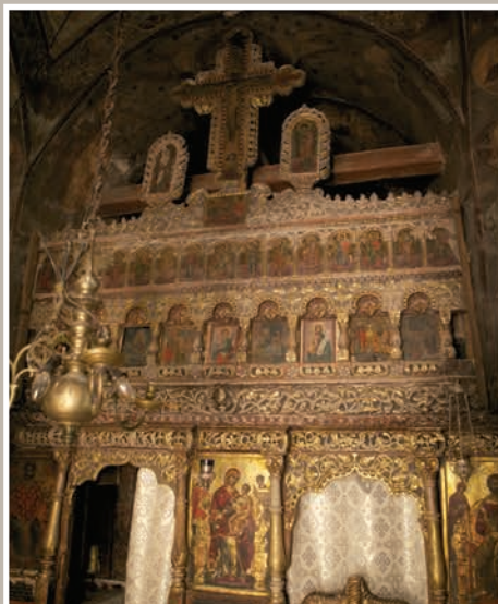
Catapeteasmă - Naos