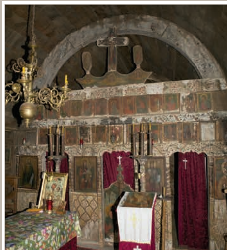
Catapeteasmă - Naos