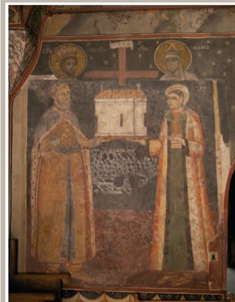
Detalii Tablou Votiv (Ctitori)

An construcție sau atestare istorică: Dată, 1812, refăcută în 1866 – conform LMI 2010