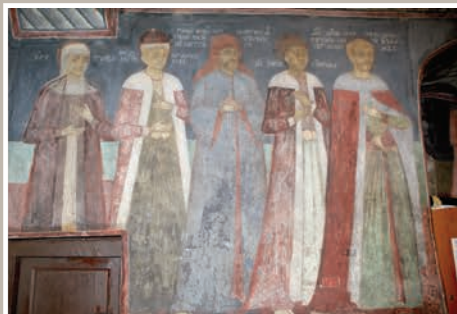
Detalii Tablou Votiv (Ctitori)