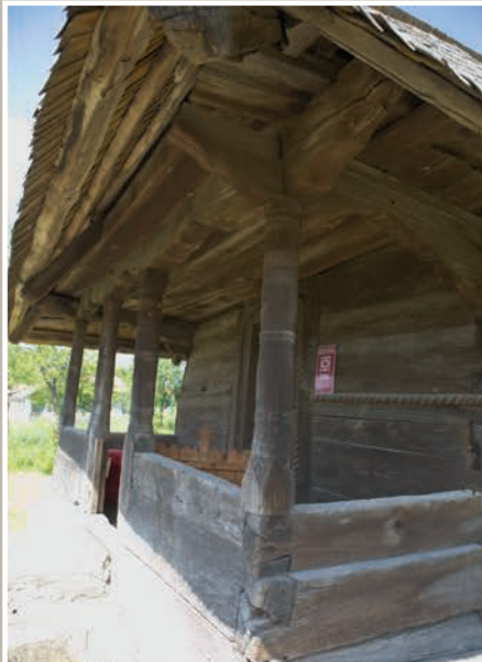
Pridvor – Vedere Laterală