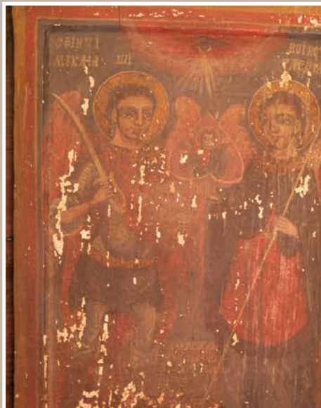
Pictură pe Lemn – Sfinții Mihail și Gavriil