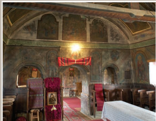
Vedere spre Naos