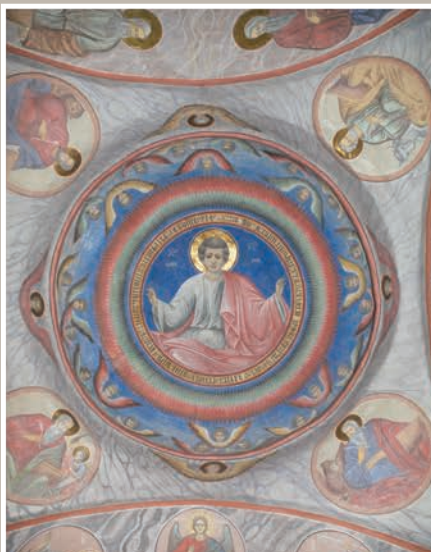
Detalii Boltă Pantocrator