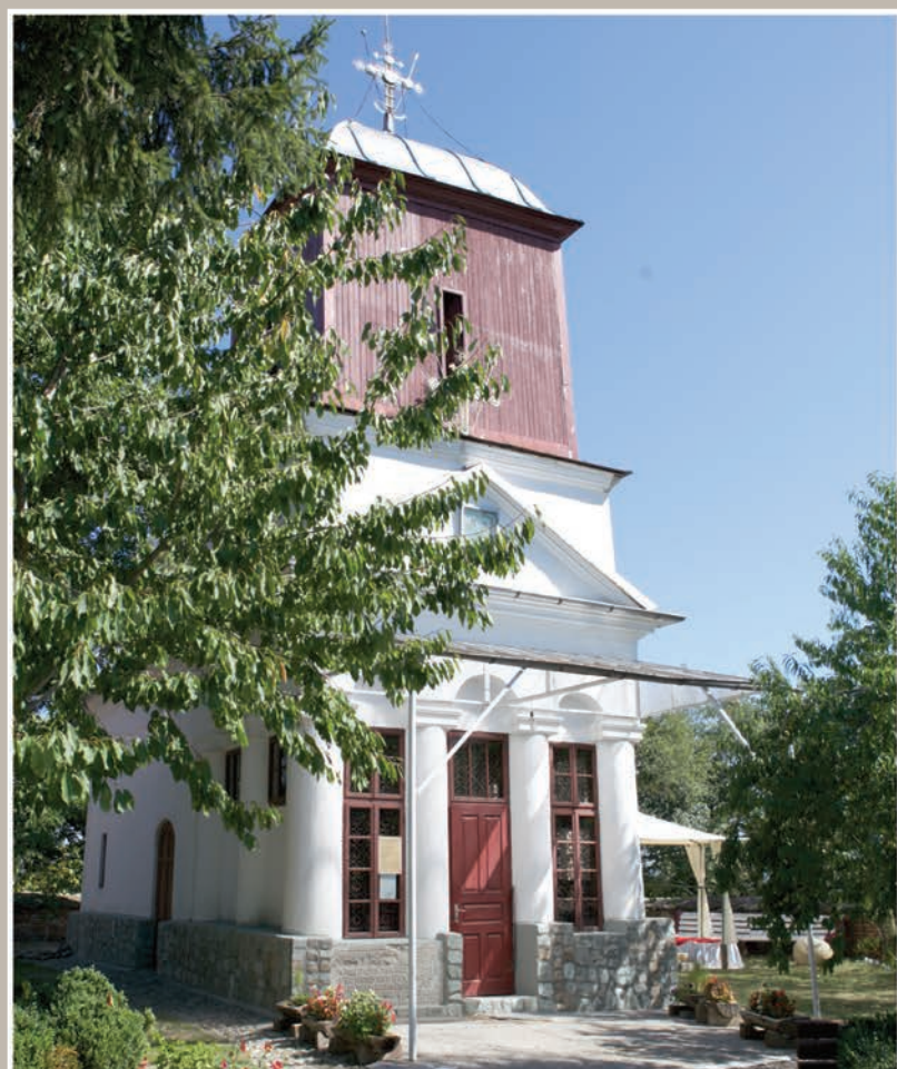
Vedere Nord-Vest – Pridvor

An construcție sau atestare istorică: Datăre, 1677-1680, refăcută în 1850-1853 – conform LMI 2010