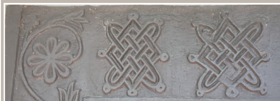
Detaliu Ușă Pridvor

municipiul RÂMNICU VÂLCEA; str. Calea lui Traian