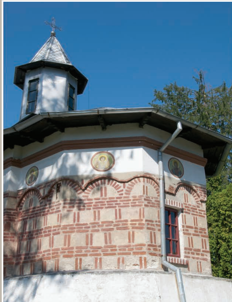
Fațadă Est-Absidă Altar

An construcție sau atestare istorică: Datare, 1568-1577 – conform LMI 2010