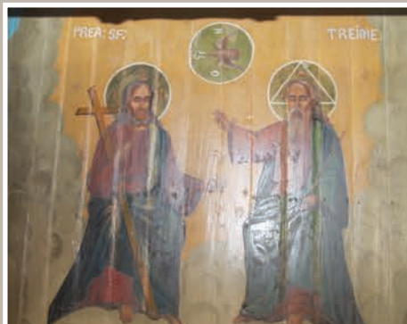
Icoană Lemn – Sfânta Treime