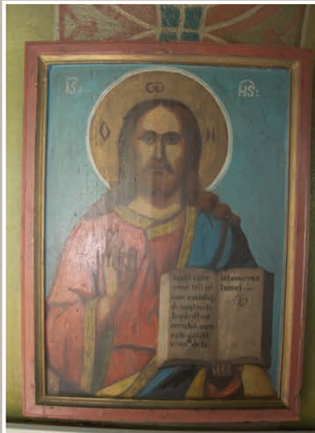
Icoană Lemn – Isus Hristos