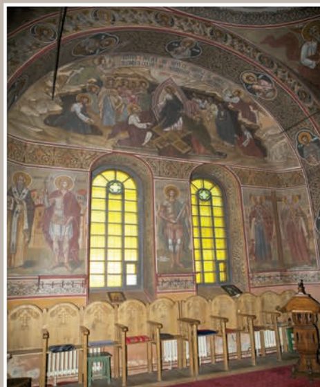
Imagine Interioară – Perete Lateral