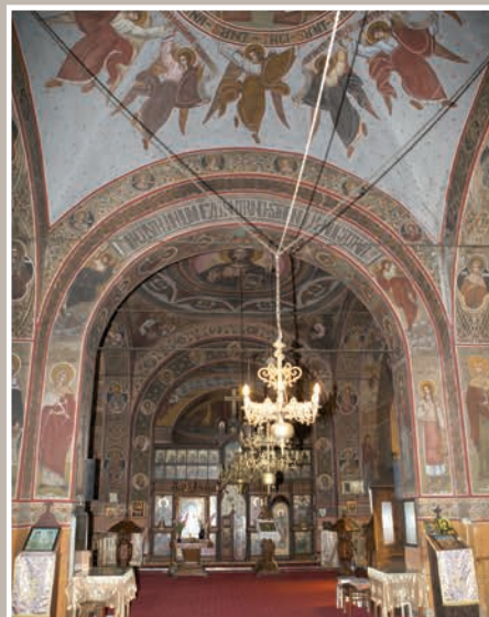
Pronaos – Vedere înspre Naos