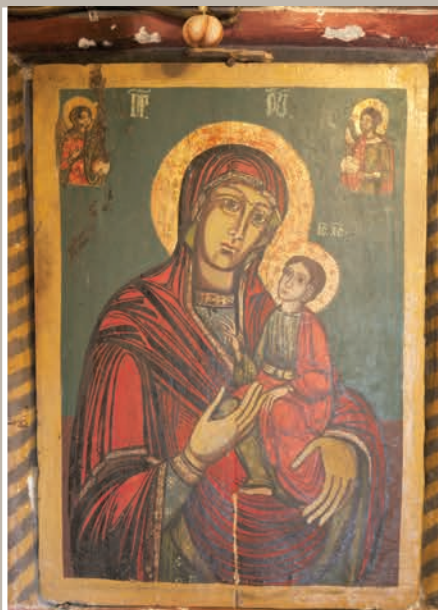
Detaliu Icoană Maica Domnului

Monument istoric. LMI 2010 VL-II-m-B-09938 sat TÂRGU GÂNGULEȘTI; oraș BERBEȘTI, Cătun Slăvești