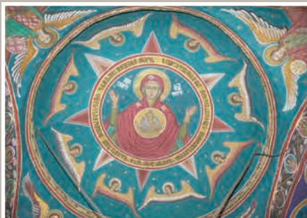
Boltă Pronaos-Maica Domnului

localitate componentă OLĂNEȘTI; oraș BĂILE OLĂNEȘTI