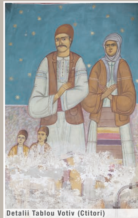
Detalii Tablou Votiv (Ctitori)

An construcție sau atestare istorică: Datare, 1810 – conform LMI 2010