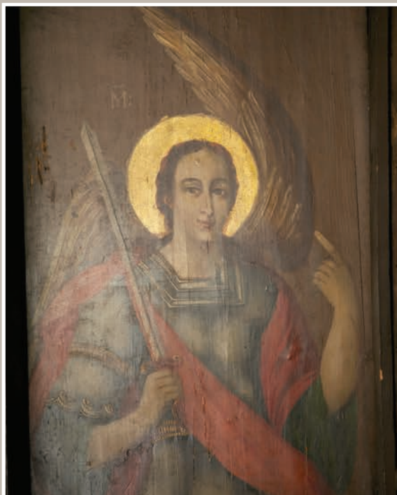
Detalii Pictură Interioară