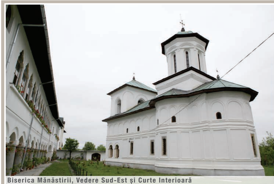
Biserica Mănăstirii, Vedere Sud-Est și Curte Interioară