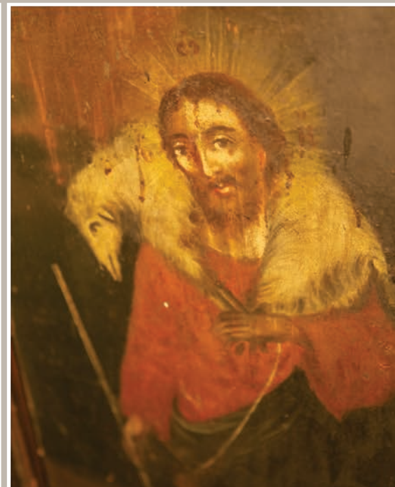
Detalii Pictură Interioară

În 1960, mănăstirea este desființată și transformată în cămin-spital „Centru de îngrijire și asistență pentru bătrâni și bolnavi cronici“, iar biserica „Sfântul Nicolae“ este transformată în biserică parohială. Începând cu anul 2006, din inițiativa Î.P.S. Gherasim, Arhiepiscopul Râmnicului, au început lucrările de amenajare a unui spațiu pentru îngrijirea bătrânilor și bolnavilor cronici, iar mănăstirea s-a redeschis. Sfânta Mănăstire Cozia este cea care se îngrijește de restaurarea ei, ca acest așezământ monastic să recâștige prestanța de altă dată, prinos de recunoștință adus ctitorilor.