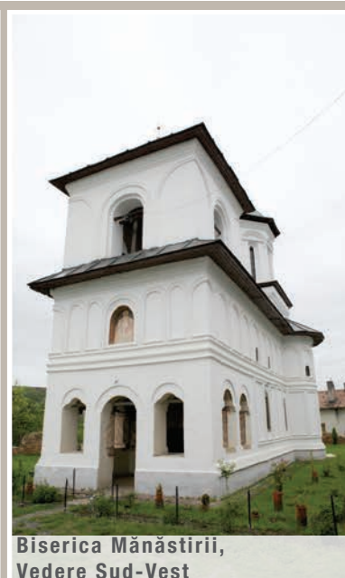
Biserica Mănăstirii, Vedere Sud-Vest