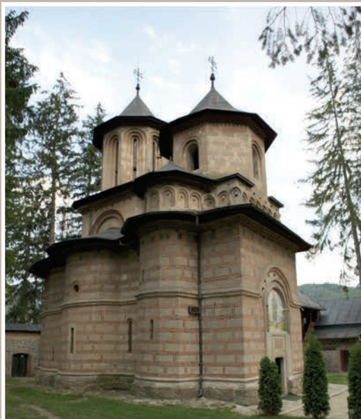
Biserica Mănăstirii, vedere Nord-Vest