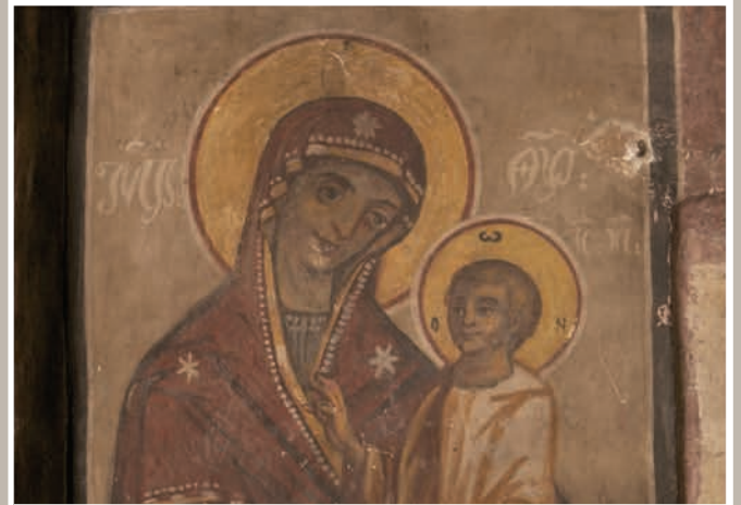
Pictură Interioară-Maica Domnului cu Pruncul

Sub stăreția părintelui arhimandrit Mina Stan, a avut loc o adevărată renaștere a schitului: biserica a fost consolidată, pictura restaurată, în latura de sud-est s-au ridicat din temelii trei clădiri cu parter și etaj, s-a mărit terenul din latura de răsărit a zidului – cetate și au fost consolidate malurile Oltului dinspre mănăstire. Biserica a fost acoperită cu tablă de aramă în anul 1983 de Episcopia Râmnicului, episcop fiind Iosif.