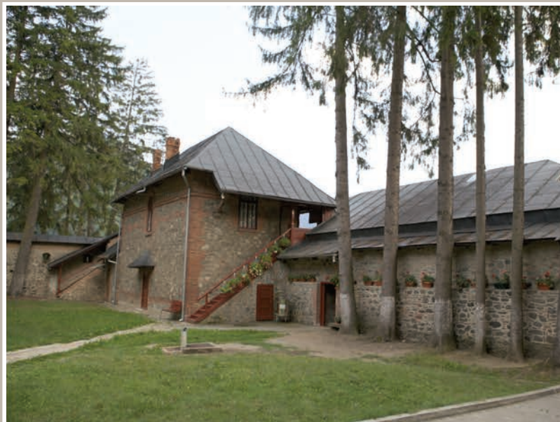
Imagini Curtea Interioară