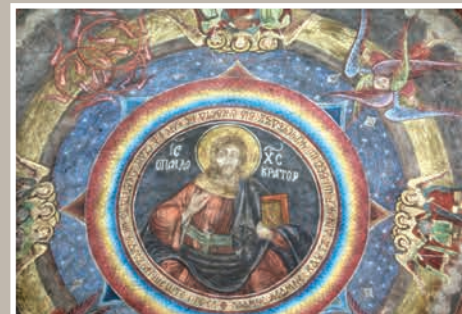
Detalii Boltă Pantocrator