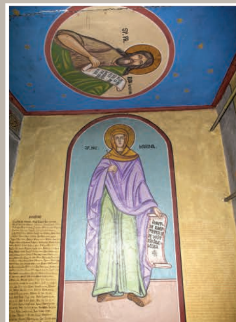
Detalii Pictură Pronaos