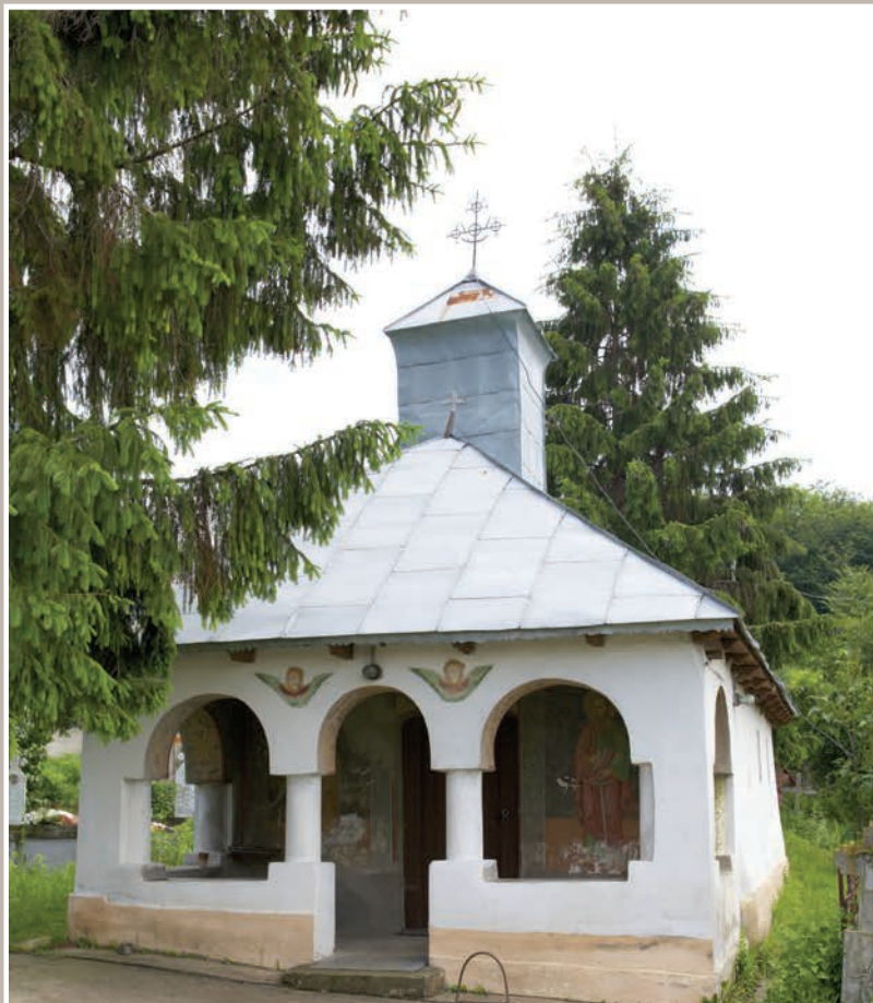
Fațadă Vest-Pridvor deschis