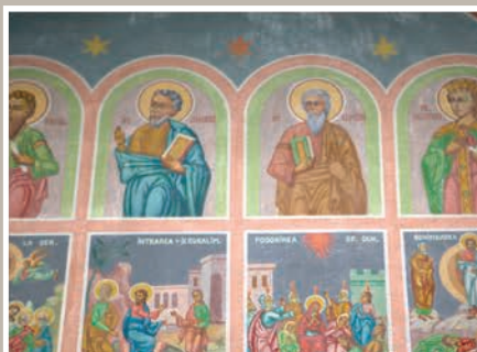
Detalii Catapeteasmă-registru superior