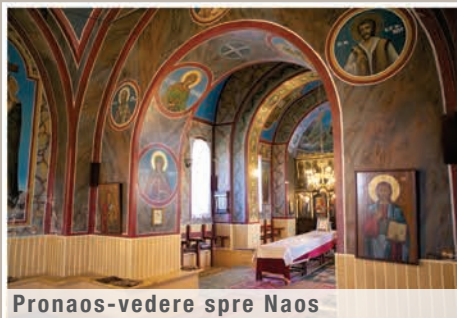
Pronaos-vedere spre Naos