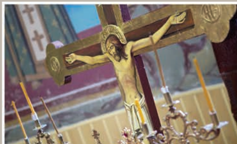
Obiect de Cult