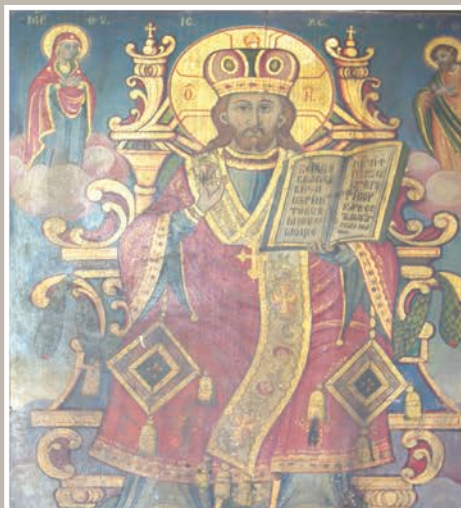
Detalii Pictură Interior