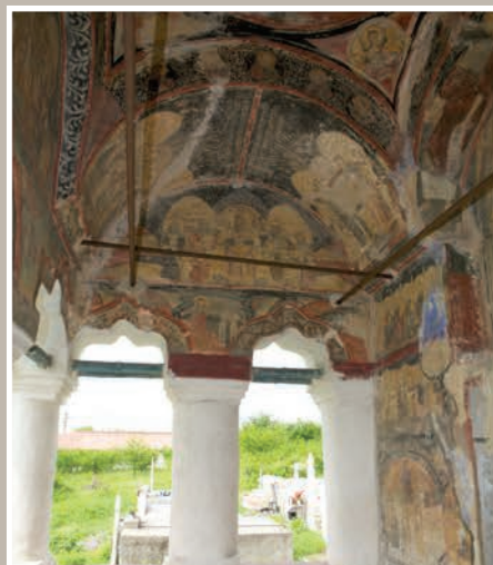
Pridvor Vedere din lătreal