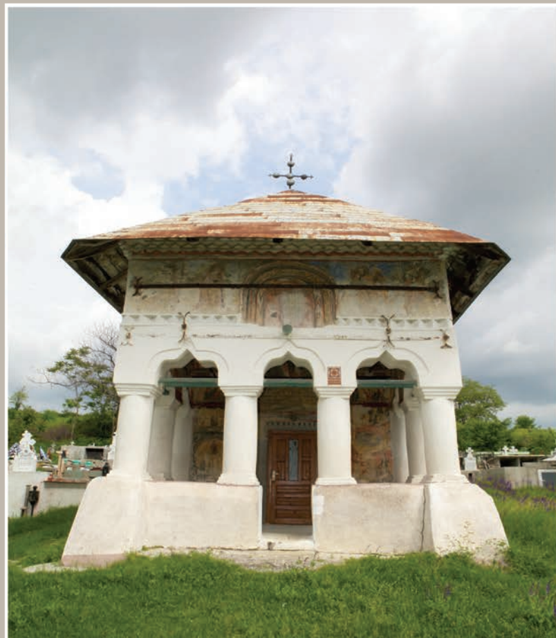
Fațadă Vest-Pridvor deschis

An construcție sau atestare istorică: Datare, 1767 – conform LMI 2010