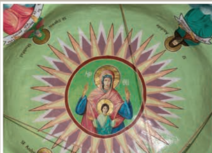
Detalii Pictură-Boltă Maica Domnului