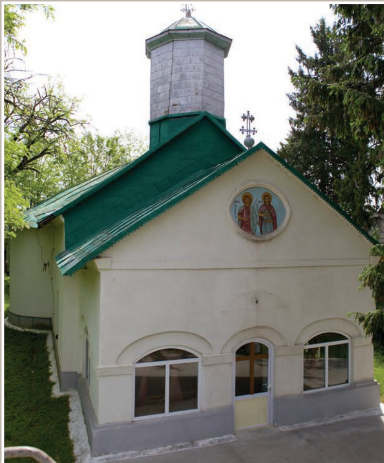
Vedere Nord-Vest Pridvor