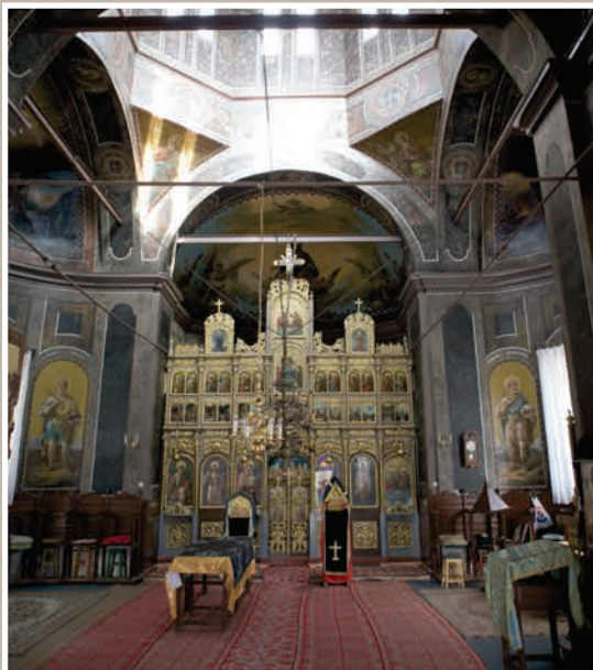
Naos vedere spre Altar