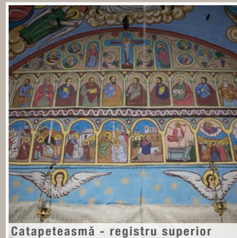
Catapeteasmă - registru superior

An construcție sau atestare istorică: Datare, 1847 – conform LMI 2010