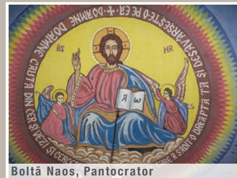
Boltă Naos, Pantocrator