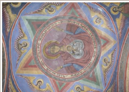
Detalii Pictură Boltă