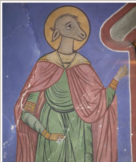
Detalii Pictură-Sfântul Hristofor