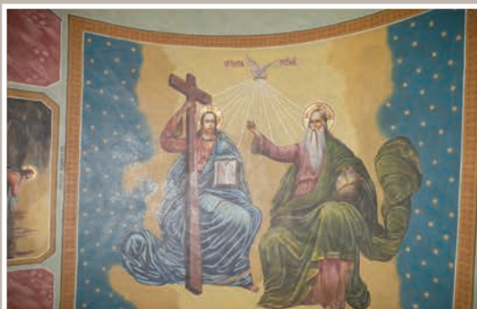
Imagini interioare-detalii picturi-Sf.Treime