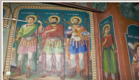
Imagini interioare - detalii picturi

An construcție sau atestare istorică: Datare, 1880-1886 – conform LMI 2010