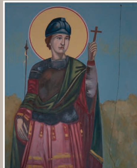
Detalii pictură interioară

An construcție sau atestare istorică: Datăre, 1913 – conform LMI 2010